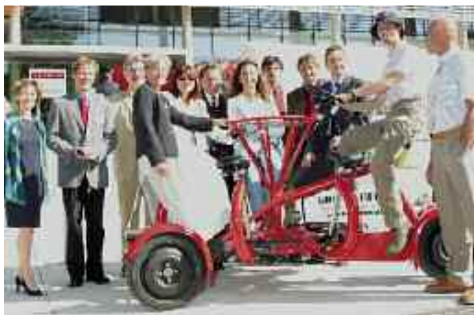
Die PartnerInnen der EUREGIO Steiermark-Slowenien spielen auch in der neuen Strukturfondsperiode eine wichtige Rolle bei der grenzüberschreitenden Projektentwicklung.