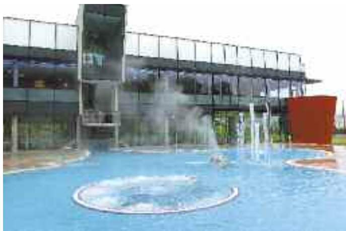
Die Therme Nova in Köflach, ein touristisches Leitprojekt der Region, wurde auch mit Ziel 2 Fördermitteln realisiert.

Damit kann sichergestellt werden, dass die Steiermark auch weiterhin zu den innovativsten Regionen in Europa zählen wird.