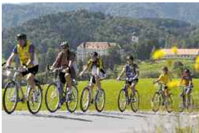
Genussradeln ist eines der Vorzeigeprojekte der LAG-Weststeiermark.

Auch für die neue Strukturfondsperiode gilt: Regionalentwicklung kann nur gelingen, wenn viele das Gleiche denken und wollen und gemeinsam in eine Richtung ziehen. Die LAG Weststeiermark hat bereits gezeigt, wie es geht und wird diesen erfolgreichen Weg mit Sicherheit fortsetzen.