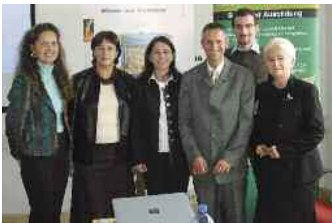
Der Ausbildungsverbund Metall ist eines der Vorzeigeprojekte des regionalen Beschäftigungspaktes.